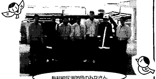
飯 村 校 区 消 防 団 の み な さ ん

さ ら に、災 害 時 に は 停 電 の た め エ レ ベ ー ター が 使 え な く な る の で、皆 さ ん お 互 い に 声 を 掛 け 合 い な が ら、階 段 を ゆ っ っ き り と 降 り る 訓 練 も 行 っ て い ます。